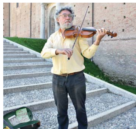
Serata organizzata da Porana Eventi pro raccolta fondi per la Parrocchia e i lavori di restauro. Info 389.2566296, www.porana.it o pagina facebook.

te che entravano a far parte del bagaglio culturale collettivo di una comunità. Il cantastorie è l'erede del giullare medievale, che può essere considerato il progenitore di tutta la famiglia degli 'artisti di strada' – giocolieri, saltimbanchi, acrobati – esperti nell'arte di divertire il pubblico con il canto, la musica, la danza, la recitazione. Diffusi a partire dal 10° secolo in Italia, in Francia, nella Penisola Iberica, in Inghilterra e in Germania, i giullari vivevano ai margini della vita sociale ed erano spesso condannati dalla Chiesa per i loro costumi troppo liberi. Divenuti ben presto figure assai popolari, si potevano incontrare negli incroci delle strade di grande traffico, all'ingresso delle chiese, nelle piazze e nei castelli, soprattutto nei giorni in cui si celebravano ricorrenze religiose o feste nuziali. Ingresso ad offerta. In caso di maltempo il concerto si svolgerà in Chiesa. Al termine degustazione dei prodotti tipici del territorio, miccone con salame, vino dell'Oltrepò e torte casalinghe.